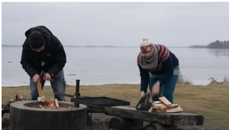
Slöjd håller i mörkret - utmaning 2021 (Slöjd håller-veckan 2021, You Tube)

Under Slöjd Håller veckan, som i år pågick mellan 22 och 28 mars erbjöds ett omfattande och inspirerande program som på olika sätt synliggjorde hur man i olika län, på olika sätt, tar sig an och arbetar med hållbar utveckling genom praktiskslöjdhandling. Under veckan bjöds publiken bland annat in till digitala föreläsningar, såsom Slow Fashion – din guide till smart och hållbart mode och Ull – naturens egen superkraft . Det arrangerades en slöjdlärofortbildning, digitala workshops och även ett Slöjd Quiz med fina vinstchanser där syftet var att engagera och öka människors kunskaper om hur slöjden bidrar till hållbar utveckling. Ett filmat samtal om ullens hållbarhets fördelar publicerades. En spännande synergieffekt var att veckan i år sammanföll med Earth Hour . Som programaktivitet bjöds publiken in att dela olika förslag på saker man kan slöjda i mörkret , för att spara energi, och samtidigt lysa upp i mörkret. Detta resulterade bland annat i ljuslyktor tillverkade av återbrukad plåt, som delades via en social mediaplattform.