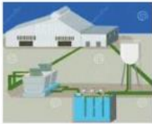
Slutna vatten system