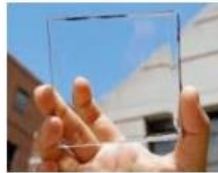
Förnybara energikällor Solceller