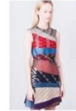
Zero waste produktion